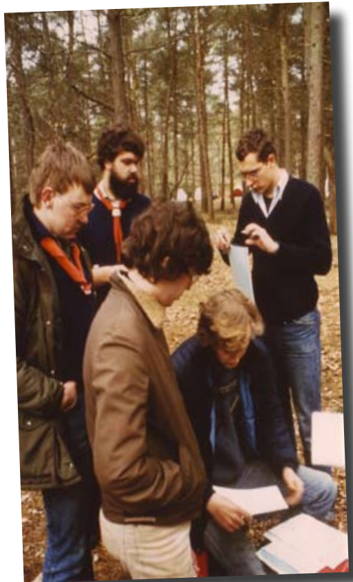
Onderweg kwamen de jongens deze groep tegen.