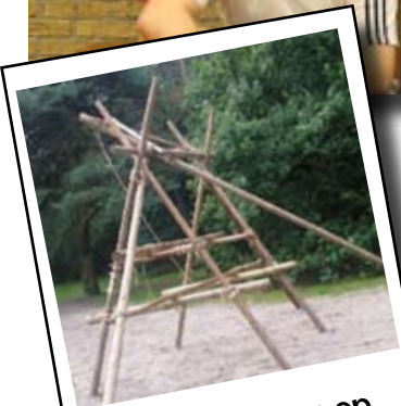
Blijdes bouwen op OUZO-kamp pag 6