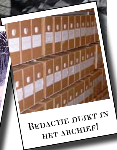
REDACTIE DUIKT IN HET ARCHIEF!