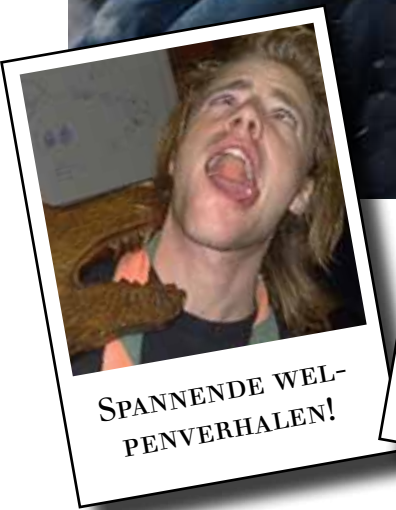
SPANNENDE WEL- PENVERHALEN!