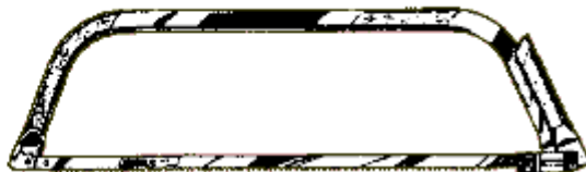
De meest gangbare beugelzagen.

Als de beugelzaag niet gebruikt wordt, zorg er dan voor dat er een beschermhoes (bijv. pvc buis of tuinslang) om het zaagblad zit. Gebruik je de beugelzaag een langere tijd niet, ontspan hem dan.